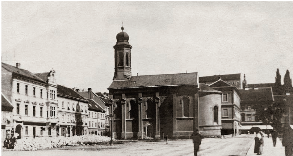
11. Pravoslavna crkva, 1898.