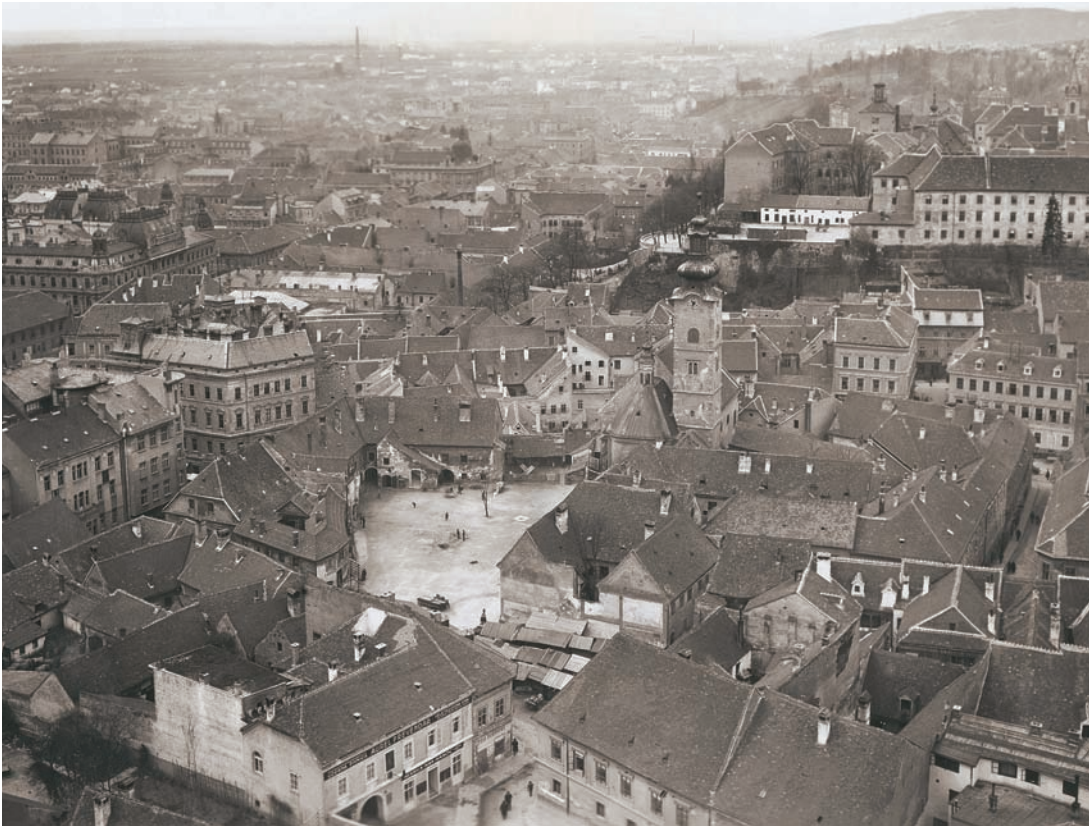
3. Dolac prije rušenja 1925. - 1928.